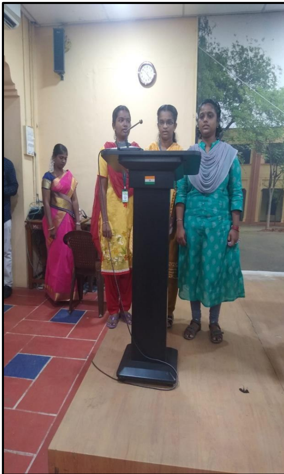
Prayer song by B.A.Tamil Students